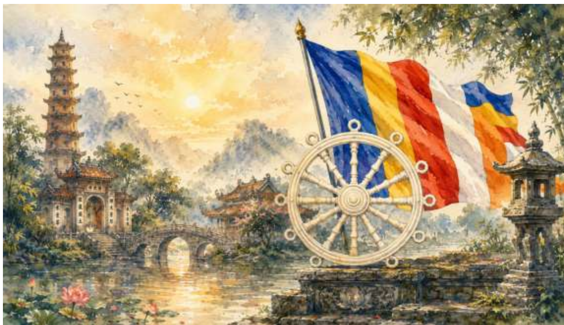
Trích Tập San Phật Việt #6, Phát hành nhân mùa Lễ Phật Đản, PL 2570 – DL 2026

Trong lịch sử hiện đại Việt Nam, nhiều thực thể xuất hiện như một cơ cấu tổ chức rồi biến hoại theo thời cuộc. Nhưng cũng có những hiện tượng lịch sử vượt khỏi giới hạn của một tổ chức thông thường để trở thành ký ức tinh thần của cả một dân tộc. Bấy giờ, Giáo Hội Phật Giáo Việt Nam Thống Nhất, nhìn trong chiều sâu ấy, không đơn giản chỉ là một Giáo hội Phật giáo được thành lập vào năm 1964 giữa cơn biến động của miền Nam Việt Nam. Đó là kết tinh của một dòng chảy lịch sử kéo dài suốt nhiều thế kỷ, nơi đạo pháp, dân tộc và thân phận con người Việt Nam gặp nhau trong những khúc quanh bi tráng nhất của thời đại.