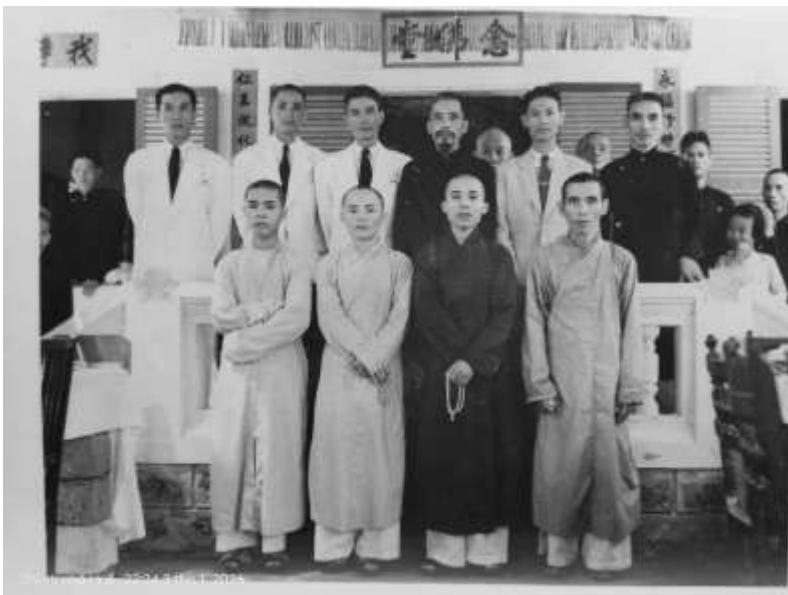
Gia Đình Phật Hóa Phổ (Huế - 1943?)

Bởi lẽ, GDPTVN chưa bao giờ là một thực thể đứng ngoài lịch sử vận động của Phật giáo Việt Nam để rồi “trước” hay “sau” Giáo Hội theo nghĩa như hai thực thể riêng biệt. Tổ chức này sinh ra từ chính nhu cầu tự bảo vệ và phục hưng Phật giáo Việt Nam trong thời kỳ lịch sử đầy biến động đầu thế kỷ XX. Từ những đoàn thể đầu tiên cho đến khi phát triển thành Gia Đình Phật Tử Việt Nam, tất cả đều nằm trong cùng một dòng chảy chấn hưng Phật giáo — một dòng chảy mà ở đó, cư sĩ trí thức, chư Tăng và tuổi trẻ Phật tử cùng chia sẻ chung một thao thức đó là làm thế nào để Phật giáo không bị đẩy ra ngoài đời sống dân tộc và không tan rã trước áp lực của thời đại mới.